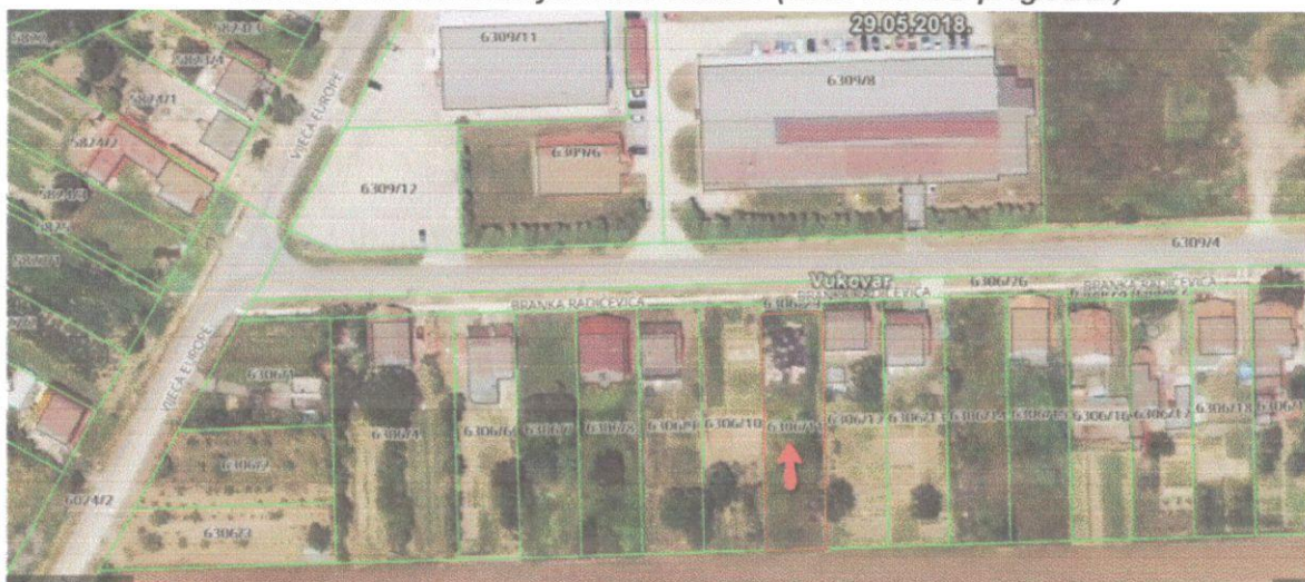
Slika br. 1: Makrolokacija k.č.br. 6306/11 (izvor: GEOPORTAL)