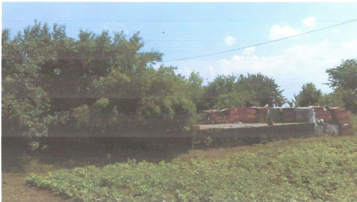
Sl.br.5: K.č.br. 6306/11