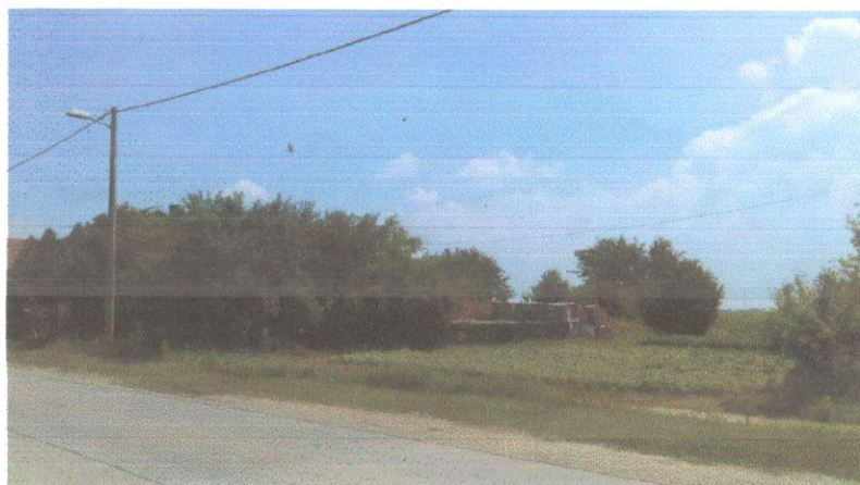
Slika br.4: KČ.br. 6306/11

Budući da se navezeni građevinski materijal u svakom trenutku može odvesti sa parcele, njegova vrijednost neće biti obračunata u tržišnoj vrijednosti nekretnine. Izgled i stanje k.č.br.6306/11, u vrijeme očevida, 25.05.2018., može se vidjeti na fotografijama 4 i 5: